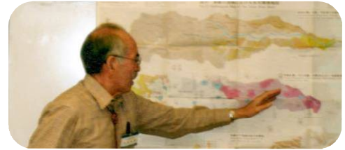
図表を使って説明する筆者

る御殿峠礫層が発達し、これを火山灰の多層ローム層、立川ローム層が覆う。流域に降った雨はこれらの地層を通して浅い地下水や深い地下水となり、あるいは地形と土地利用の影響を受けながら河川流出となり、蒸発散となる。低地部の完新世沖積層と更新世洪積層には豊富な地下水が貯留されていることから、開発前(宅地面積:9%)は開放井戸や掘削井戸によって農業用水や生活用水に利用されていた。また、約 100m 以深の被圧された自噴井は動力用水の必要がなく、営農者・養魚者・酪農者などにとっては有益な環境にあった。しかし、化学肥料施肥、家畜糞尿流出、家庭排水などによる大栗川の水質汚濁は極限に達していた。ニュータウン開発(宅地面積:42%、道路面積:19%)は流域の水循環を脆弱化させた(人工の水循環による都市型流出などが、一方で、上下水道の整備がなされたために河川水質(COD、BODとも基準値前後)は改善された。以上本記述では、水質の計測値は省略しました。