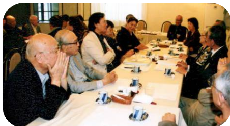
座談会中の皆さん