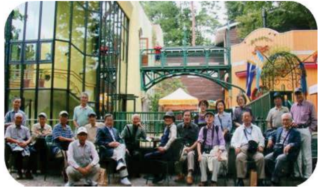
ジブリ美術館前で

工夫を凝らした各展示室は、期待を裏切らなかつた。緻密な検証と計算、豊かな発想、優れた技術等に裏付けされた宮崎ワールドを堪能させてくれた。「発想と予感、そして皆さんのスケッチとイメージの断片。その中から映画の核となるべきものが見えて来ます」と、作製者でもあった私の心に残った宮崎駿の言葉である。「いや来て良かったよ」「癒された」「若返った」と会員たちにも、それぞれ思惟を与えてくれたジブリであった。