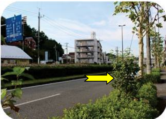
鎌倉街道沿い街路樹「サンシュユ」の若木