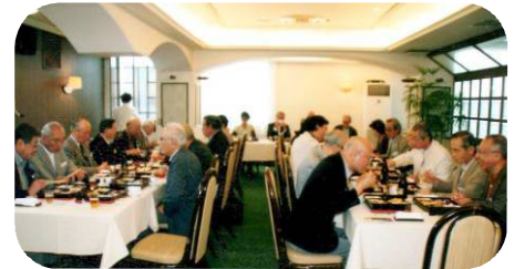
10月1日開催の 楽しく和やかな 雰囲気の良い昼食会

3) 文書規定に則り、5&10周年記念誌等の資料を電子ファイル化し、事務局に一括移管した。