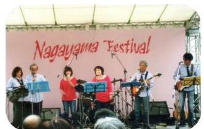
タマピカルの演奏(左から二人目が筆者)

多摩市永山公民館主催で開催された軽音楽祭「永山フェスティバル」は今年で第16回を迎え、9月22・23日の2日間で行われた。