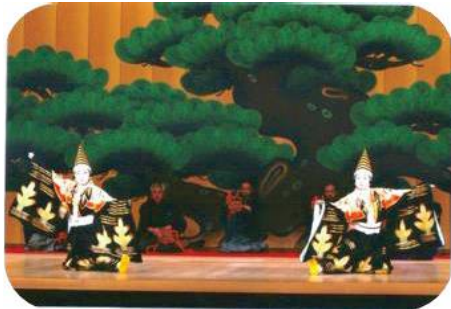
「二人三番叟」を踊る筆者(右)

今回の演目は「三番叟」でした。「三番叟」は能の翁を元にした祝儀物で、天下泰平、五穀豊穰、子孫繁栄をもたらす内容です。私が踊った「二人三番叟」